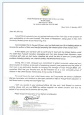
▲ 엘살바도르 유엔대표부 대사 뇌교육 도입 감사메시지