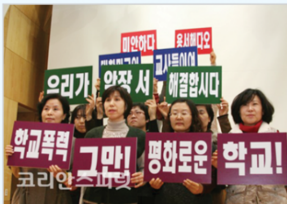
▲ 흥익교원연합, 학교폭력예방과 대안제시 세미나 개최