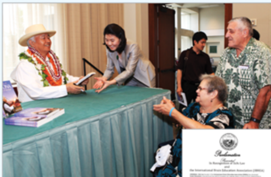
▲ 미국 하와이주, '국제뇌교육협회의 날' 지정