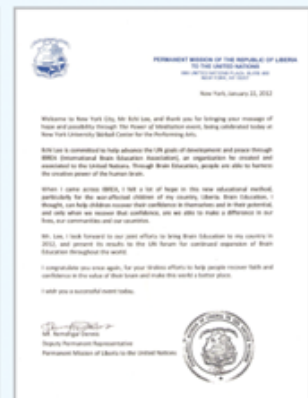
▲ '라이베리아 유엔대표부 대사, 뇌교육 도입요청 레터 보내