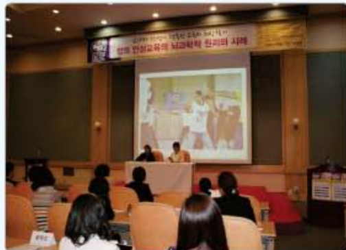
▲ 글로벌이슈 뇌교육 전국 6개 도시 세미나