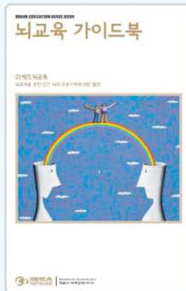
▶ 뇌교육가이드 BOOK 발행