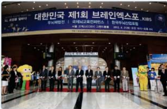
대한민국 제1회 브레인엑스포 개최 ▲